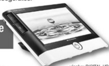
visolux DIGITAL HD Lesekomfort auf ganzer Linie